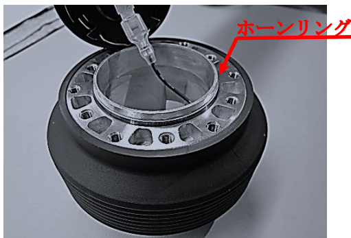
MOMOタイプホーンボタン